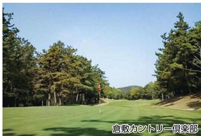
倉敷カントリー倶楽部