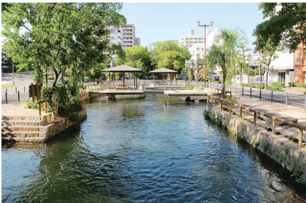
撮影/小林和義 会員 西川緑道公園風景